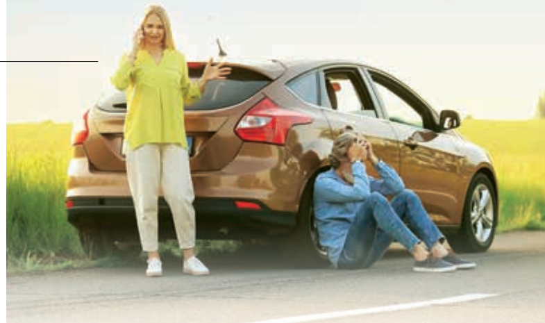
BITTE WARTEN: Notruf-Hotlines sollten jederzeit erreichbar sein

Die Bewährungsprobe für Schutzbrief-Anbieter beginnt nicht erst dann, wenn das Auto bereits mit einer Panne am Seitenstreifen liegen geblieben ist. Auch vor und selbst unabhängig von einem möglichen Ernstfall gibt es viele Gelegenheiten, sich zu beweisen: mit einem überzeugenden Produktangebot, fairer Beratung und klarer Kommunikation. Besonders gut wurden in den entsprechenden Kategorien die Merkmale „Verbindlichkeit von Aussagen“ und „Angebotsvielfalt“ bewertet, gefolgt von der „Verständlichkeit der Kommunikation“ und der „Fachkompetenz“ der Anbieter. Dass immerhin acht von zehn