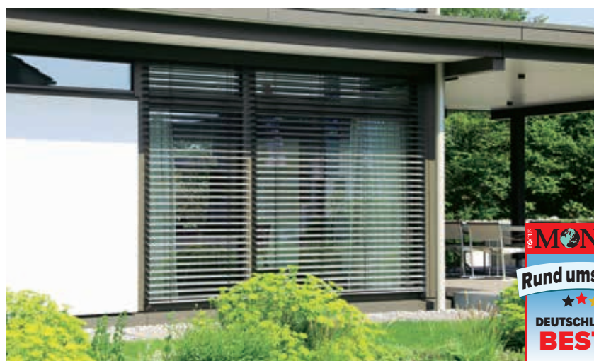
ANGENEHM SCHATTIG: Dank Sonnenschutz bleibt es drinnen kühl