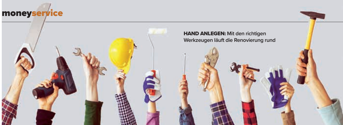
HAND ANLEGEN: Mit den richtigen Werkzeugen läuft die Renovierung rund