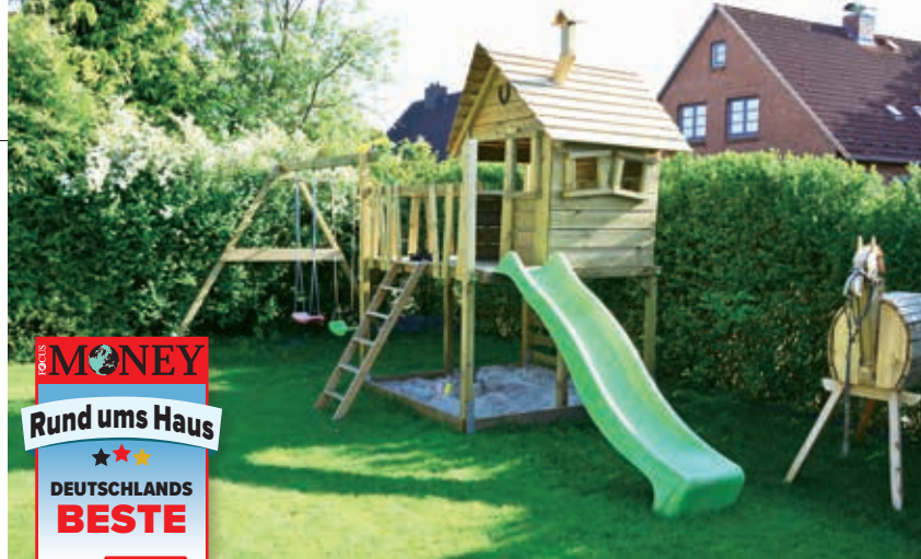
SPIELHAUS: Kinder bewerten den Spaß, Eltern die Sicherheit