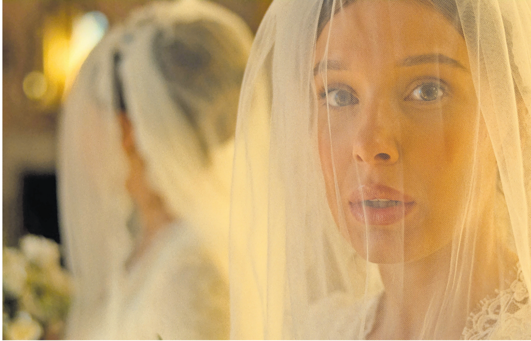
Eigentlich heißt ihr Name, rückwärts gelesen, „alone“, aber der junge Lord Tewkesbury ist eben sehr schnuckelig.

Es sieht am Anfang gar nicht gut dafür aus. Die künftige Schwiegermama hat beschlossen, der beste Ort für die Hochzeit