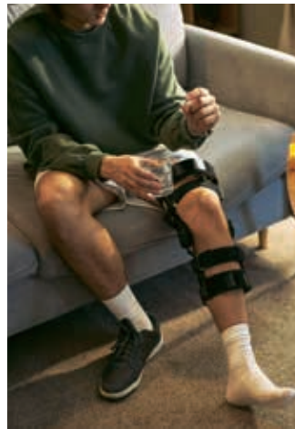
UNFALLFOLGEN: Gefragt ist unkomplizierte Unterstützung

Echte Fairness wird nicht punktuell angewandt, sondern universell gelebt. Das zeigt sich auch in den sechs Einzelrankings, wo die allermeisten Unfallversicherer in mehr als nur einem Teilbereich ausgezeichnet wurden. Das Prädikat „Sehr Gut“ in allen Kategorien haben sechs Anbieter geschafft: ADAC Versicherungen, Allianz, HanseMerkur, HUK-COBURG, LVM Versicherung und R+V. CosmosDirekt, PROVINZIAL und Württembergischer ist das immerhin noch in jeweils vier Kategorien gelungen.