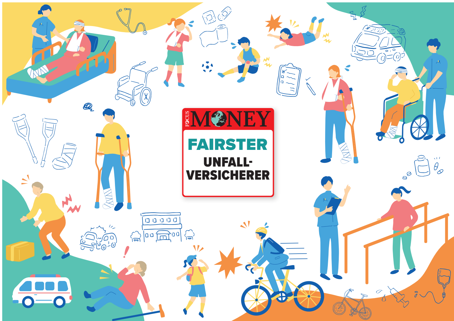
PLÖTZLICH PASSIERT: 70 Prozent aller Unfälle ereignen sich in der Freizeit, beim Sport oder im Haushalt